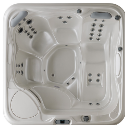
MY SPA 215 | Vue du dessus