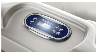
Commande Balboa, simple et intuitive