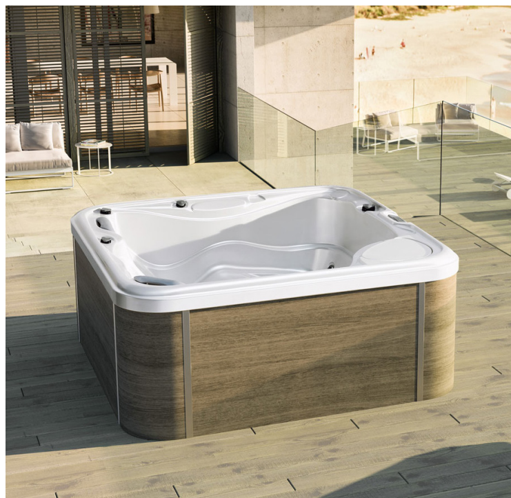
↑ MY SPA 215 Spa en acrylique, avec tablier en PlyLite (Coloris Rovere miele)