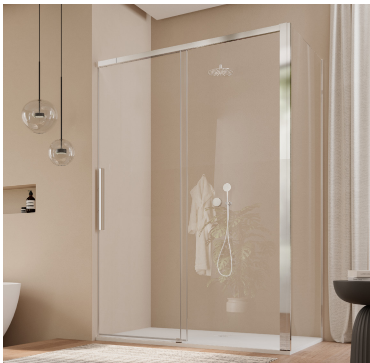
↑ ORIANA Porte coulissante 2 volets dont 1 fixe D36S2 + paroi fixe à 90° D36F3 (Finition Poli-brillant)