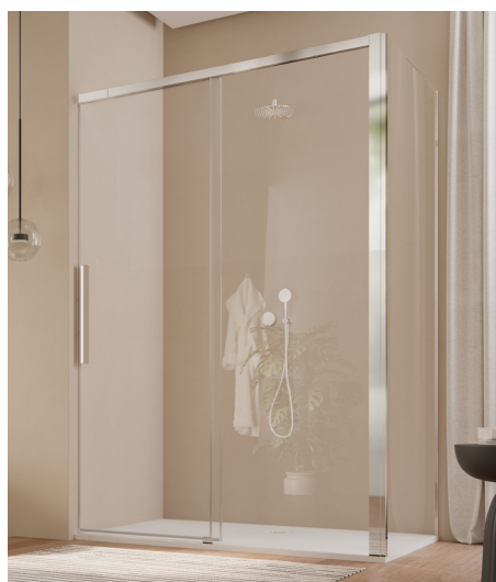
↑ Finition Poli-Brillant