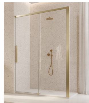
↑ ORIANA Porte coulissante 2 volets dont 1 fixe D36S2 + paroi fixe à 90° D36F3 (Finition Doré brossé)