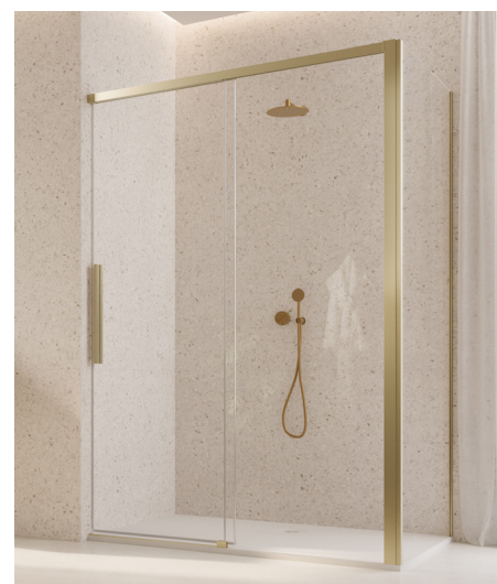
↑ Finition Doré brossé