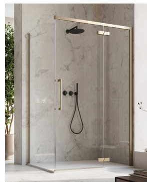
↑ Finition Métal Champagne