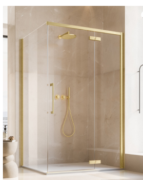
↑ Finition Doré brossé