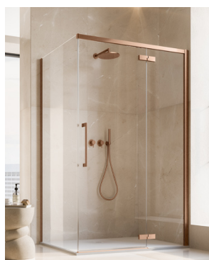
↑ Finition Or rose brossé