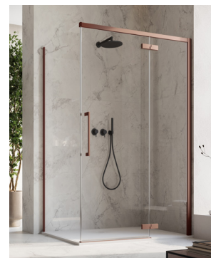
↑ Finition Métal Bordeaux