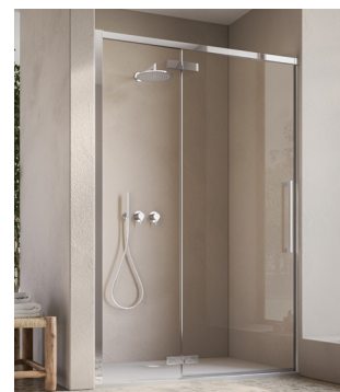
↑ ORIANA Porte pivotante et paroi fixe en ligne D36T13L (Finition Poli-Brillant)

Cette fiche produit est utilisée à titre d'information et comme support de travail. Les ajustements complémentaires selon les spécificités du client doivent être pris en considération. Les finitions et/ou mesures spéciales ne seront ni reprises, ni échangées en cas de mauvaise prise de côtes. Dimension en mm. Sous réserve de modifications techniques. Photos non contractuelles.