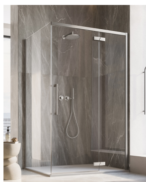
↑ Finition Nickel brossé