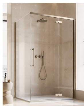
↑ Finition Bronze brossé