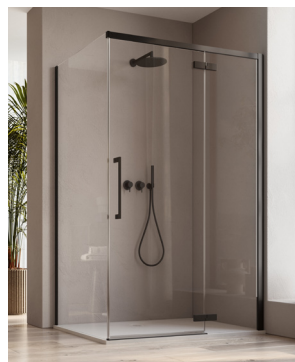
↑ Finition Noir mat