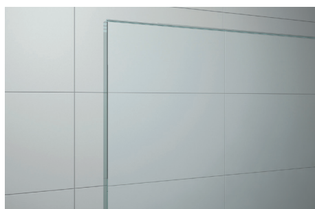
↑ Vitrage Transparent