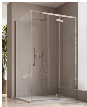
↑ Finition Poli-Brillant