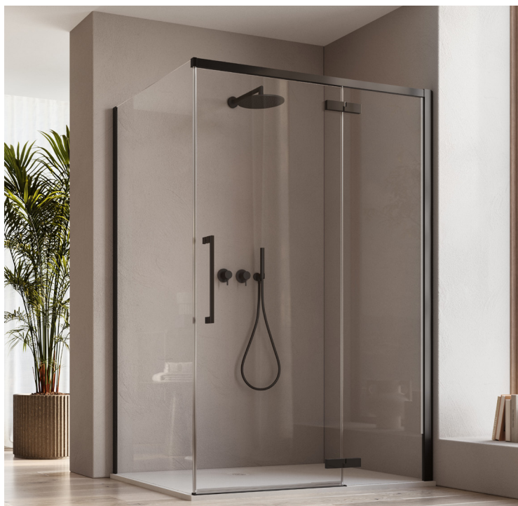
↑ ORIANA Porte pivotante et paroi fixe en ligne D36T13R + paroi fixe à 90° D36F1 (Finition Noir mat)