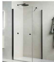
↑ Finition Gun métal brossé