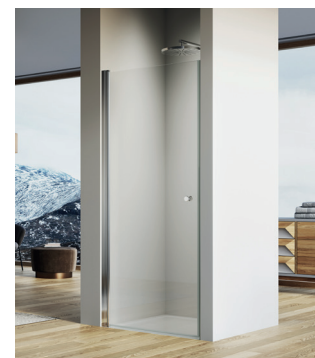
↑ SOLINO Porte pivotante SOL1 (Poli-brillant)