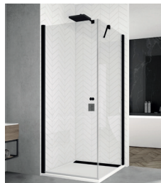
↑ Finition Noir mat