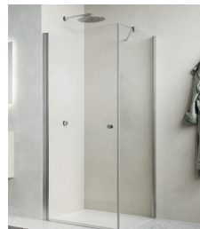
↑ Finition Nickel brossé