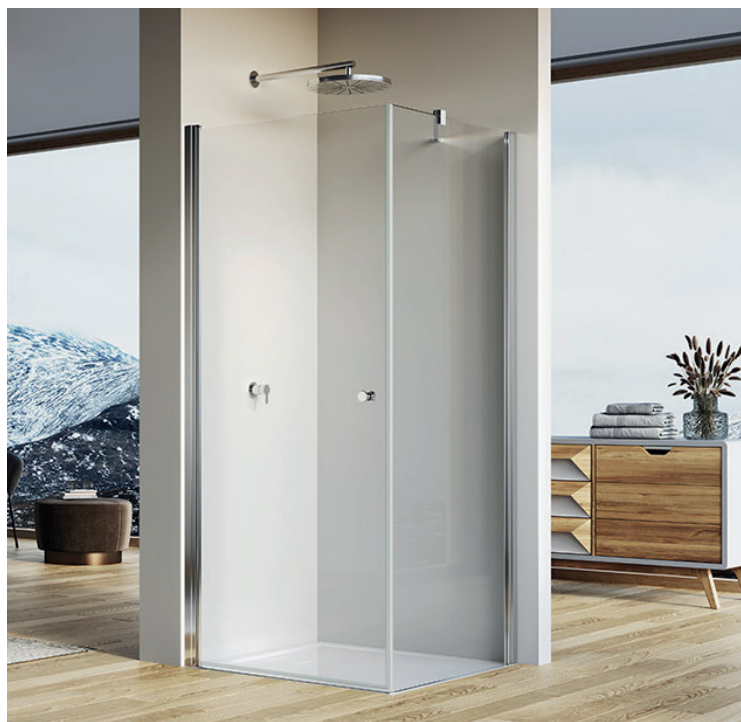
↑ SOLINO Porte pivotante SOL1 + paroi fixe à 90° SOLT1 (Poli-brillant)

Livrée avec notice de montage et accessoires