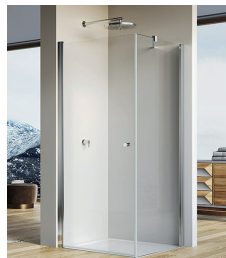
↑ Finition Poli-Brillant