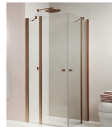
↑ Finition Or rose brossé