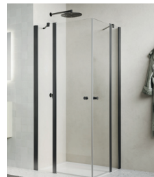
↑ Finition Gun métal brossé