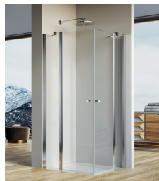
↑ Finition Poli-Brillant