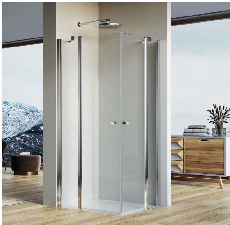
↑ SOLINO Accès d'angle pivotant partiel SOL13 G+D (Poli-brillant)

Livree avec notice de montage et accessoires