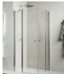
↑ Finition Nickel brossé