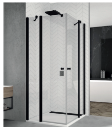
↑ Finition Noir mat