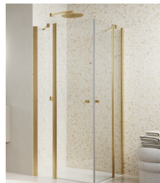
↑ Finition Doré brossé