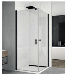
↑ Finition Noir mat