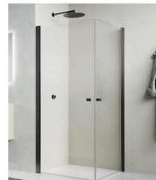
↑ Finition Gun métal brossé