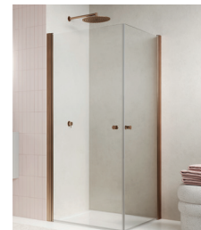
↑ Finition Or rose brossé