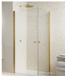
↑ Finition Doré brossé