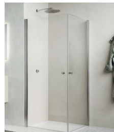
↑ Finition Nickel brossé