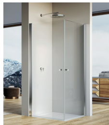
↑ Finition Poli-Brillant