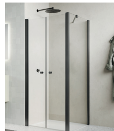
↑ Finition Gun métal brossé