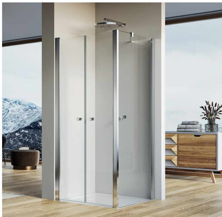
↑ SOLINO Porte battante SOL2 + paroi fixe à 90° SOLT2 (Poli-brillant)

Livrée avec notice de montage et accessoires