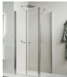
↑ Finition Nickel brossé