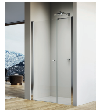
↑ SOLINO Porte pivotante avec fermeture sur paroi fixe en ligne SOL31 (Poli-brillant)