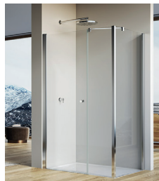
↑ Finition Poli-Brillant