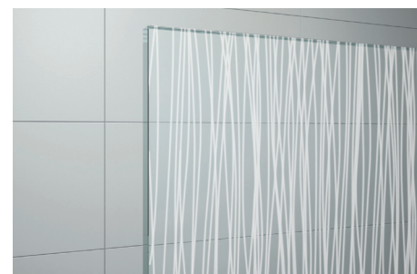
↑ Vitrage Lines