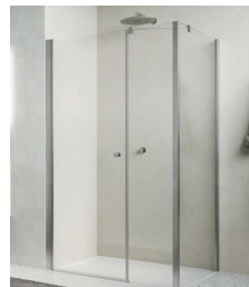
↑ Finition Nickel brossé