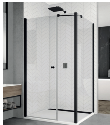
↑ Finition Noir mat