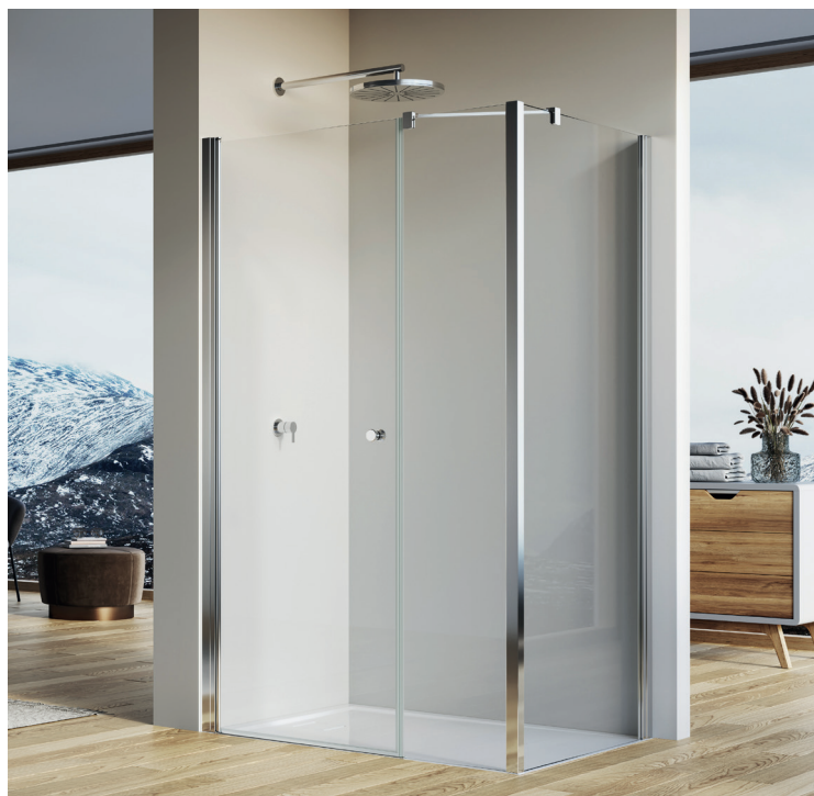
↑ SOLINO Porte pivotante avec fermeture sur paroi fixe en ligne SOL31 + paroi fixe à 90° SOLT3 (Poli-brillant)

Livrée avec notice de montage et accessoires