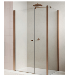
↑ Finition Or rose brossé