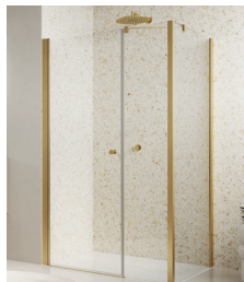
↑ Finition Doré brossé