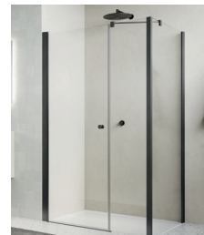
↑ Finition Gun métal brossé