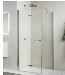
↑ Finition Nickel brossé