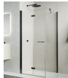
↑ Finition Gun métal brossé