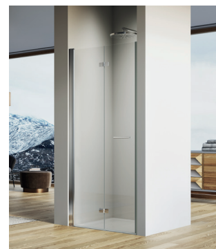
↑ SOLINO Porte repliable SOLF1 (Poli-brillant)