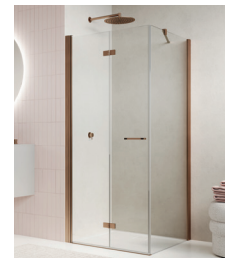
↑ Finition Or rose brossé