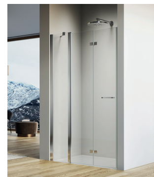
↑ SOLINO Porte repliable et paroi fixe en ligne SOLF13 (Poli-brillant)