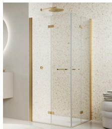
↑ Finition Doré brossé