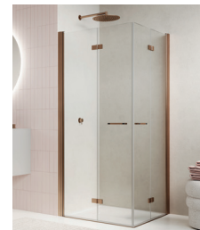
↑ Finition Or rose brossé