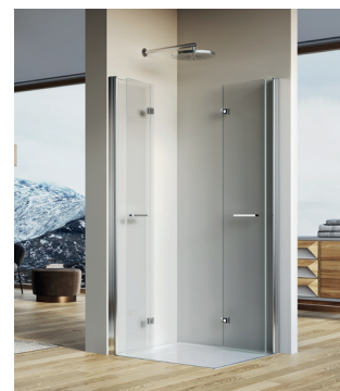
↑ SOLINO Accès d'angle repliable SOLF1 G+D (Poli-brillant)