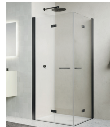
↑ Finition Gun métal brossé