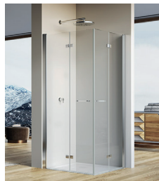
↑ Finition Poli-Brillant