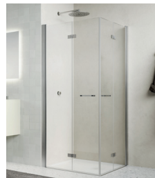
↑ Finition Nickel brossé